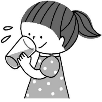
喉が渇く前にこまめに水分をとる