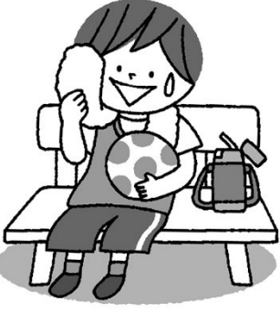
運動するときにはこまめに休憩をとる