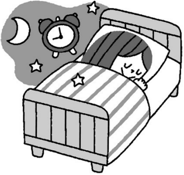
規則正しい生活で体調を整える