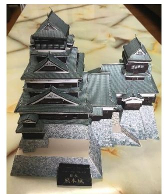
日本の名城 熊本城