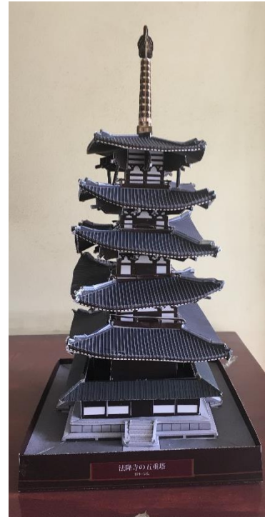
奈良 法隆寺五重塔 【国宝・世界遺産】 ペーパークラフトで作成

どこの国でも同じですが、子育てや人間教育において、なんでも好きな物を買って与えて、贅沢をさせるとするのは、子どもを駄目にしてしまう「むごい教育」をしていることになりませんか。ゲームが欲しい、スマホが欲しい、野菜は嫌いだから食べない、遊び疲れたから休む、という生活を続けていたら、わがままで、駄目な人間になってしまいます。家康は、こうした義元の策略に乗らず、家臣団を大事にし、質素儉約を貫いて天下を統一します。「心に望み起らば、困窮したるときを思い出すべし。」「いさめてくれる部下は、一番槍をする勇士より値打ちがある。」どれも家康の残した名言ですが、私たちに大きな示唆を与えてくれます。